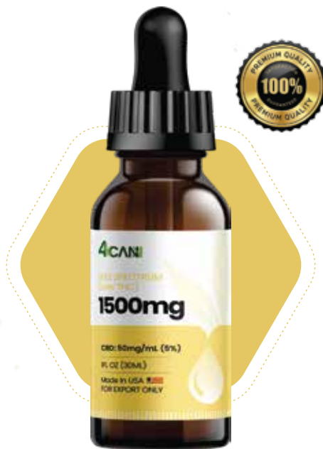
CBD Full Spectrum 50mg/mL, 30mL